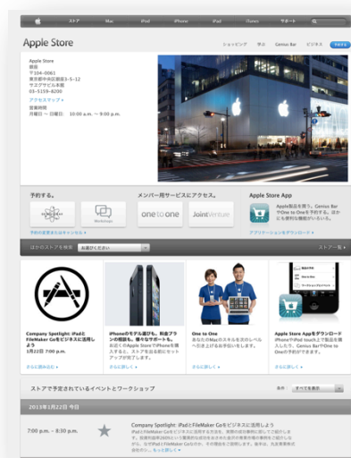
(トップページに掲載されたバナー Apple Store, Ginza のウェブサイト)