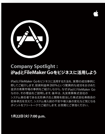
(Apple Store, Ginza 店内に掲示されたイーゼル)